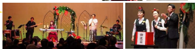
▲民謡ジャズライブや大抽選会も大盛り上がり!