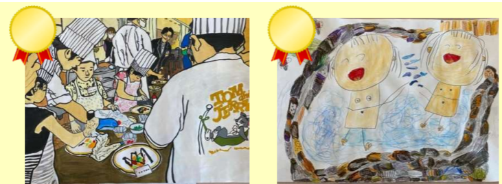
▲最優秀作品に選ばれた色彩豊かで細部にもこだわった2点

2024年10月、厳正な審査会を行い最優秀作品2点、優秀賞3点、特別賞3点を選出させていただきました。作品から笑顔が溢れ、女将達もホッコリしたようです。受賞された皆様おめでとうございます!