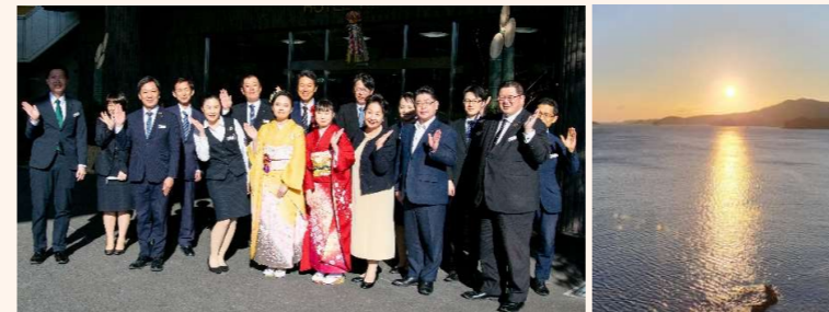
玄関前で集合写真をバシヤリ 2025年の初日の出