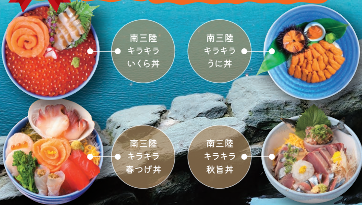
南三陸 キラキラ いくら丼