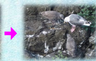
元気な2羽のヒナたちはスタッフやお客様からも大人気！