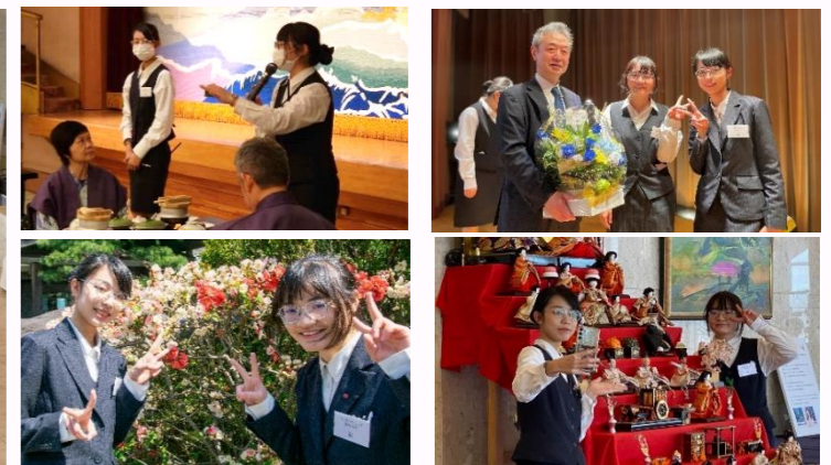
様々な場面で活躍してくださいました