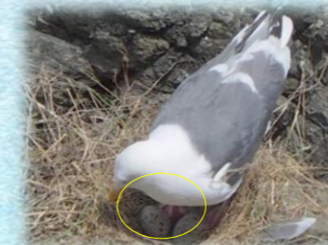
2024年5月、2個の卵を発見！

今年も6年連続でオオセグロカモメの卵を発見！場所は今回も同じホテル真下の岩場でございます。2個の卵を発見し、無事に全てが孵化！公募により「観太」と「ピー子」と名づけました！ヒナたちは日々すくすく成長しています♪無事に巣立つことを祈りつつ温かく見守っていきたいと思います。