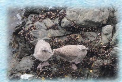
無事に巣立ってますように