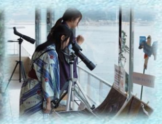
5階ラウンジからカモメの様子を観察できます！