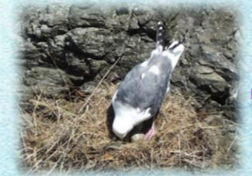
2024年6月、お母さんがクチバシで2024年6月中旬、無事に全て孵化しました！触れ始めました。孵化の兆しです！とってもかわいい～！